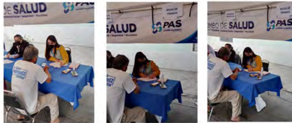
Floridos Bosques del Nogalar